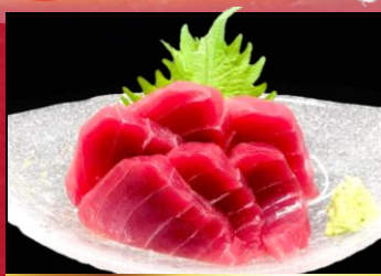
Tuna sashimi まぐろお造り ▶ 1,180円