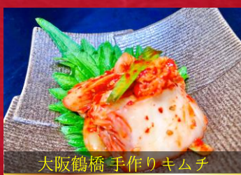
大阪鶴橋 手作りキムチ 白菜キムチ ▶ 380円