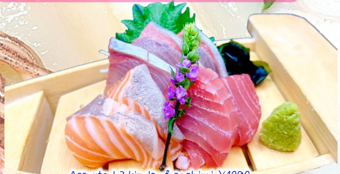
Assorted 3 kinds of sashimi ¥1080