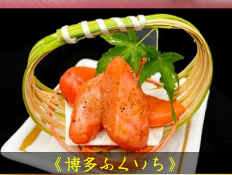
博多ふくいち 炙り辛子明太子 ▶ 680円