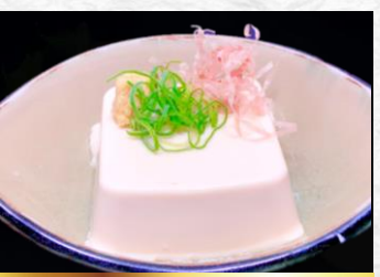
chilled tofu 冷奴 ▶ 330円