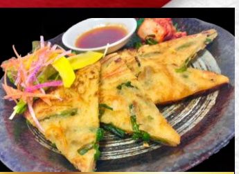
Korean pancake チヂミ ▶ 620円