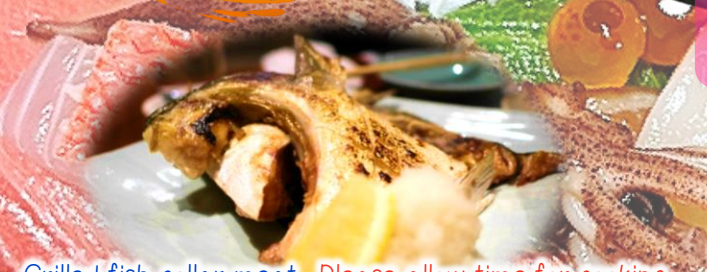
Grilled fish collar meat Please allow time for cooking.