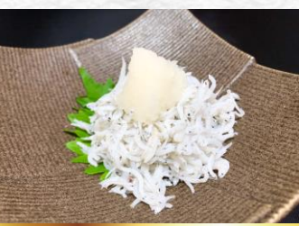
Pot-fried whitebait シラスおろし ▶ 480円