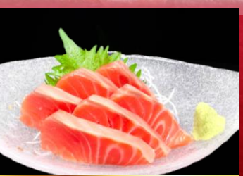
Salmon sashimi サーモンお造り ▶ 1,080円