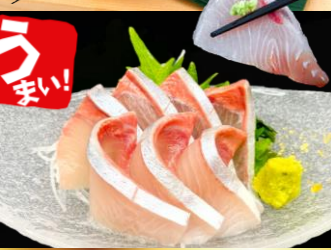
Japanese amberjack sashimi 寒ブリお造り ▶ 1,080円