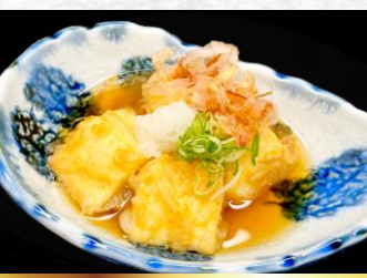
Deep-fried tofu with soup stock 揚げだし豆腐 ▶ 580円