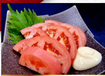
chilled tomatoes 冷やしトマト ▶ 380円