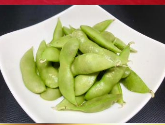
Green soybeans·Edamame エダマメ ▶ 330円