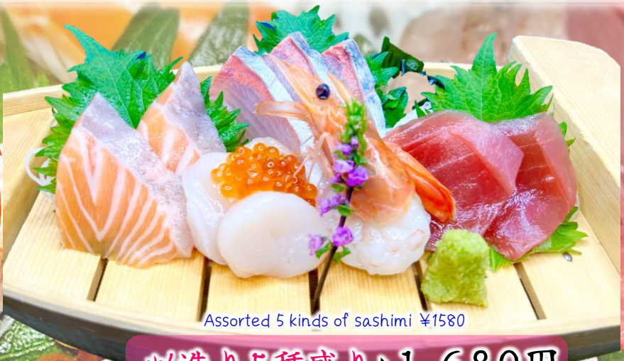
Assorted 5 kinds of sashimi ¥1580